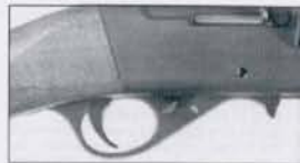
Safe position (1)

Tighten the assembly screw underneath the breech. Octalium torque is normally 110 dNm (110 deci-Newton-metres equivalent to 11 Nm or 7.95 ft. lbs). Ensure that the screw tip enters the drilled cross hole in the barrel lug with precise fit. After a longer usage check assembly screw from time to time for tight fitting.