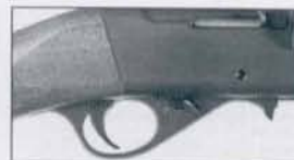
Fire position (2)

This rifle is made for using cartridges with standard velocity only. Make sure you are in a safe place to shoot and that you have the correct ammunition for your rifle. Use fresh ammunition only. See numbers 1 through 15 under "Caution" above. First of all degrease the bolt with a cloth and run a dry patch through the bore of your rifle. Push the loaded magazine all the way into the receiver until you hear a click. With the safety lever to the "FIRE" or "OFF" position (red "F" visible) draw back the bolt handle to the rear, release and let it go forward, the first cartridge is then fed